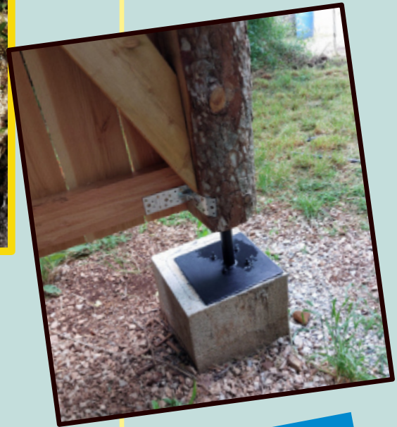
Réparation des poubelles, Peinture pieds du préau, Barre de seuil infirmerie, Tentative d'évacuation des rejets d'eau dans la taverne