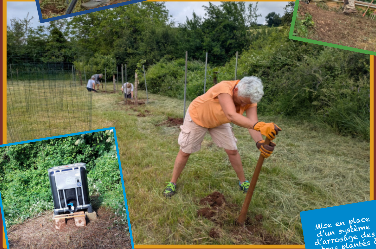
Mise en place d'un système d'arrosage des arbres plantés à l'automne