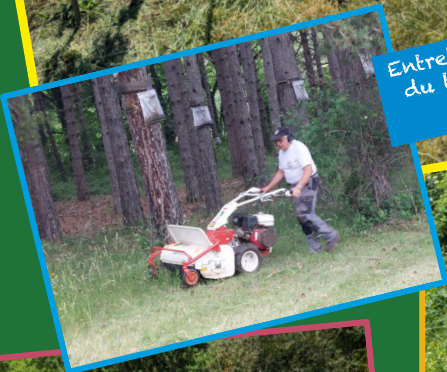
Entretien paysager du terrain et du hameau