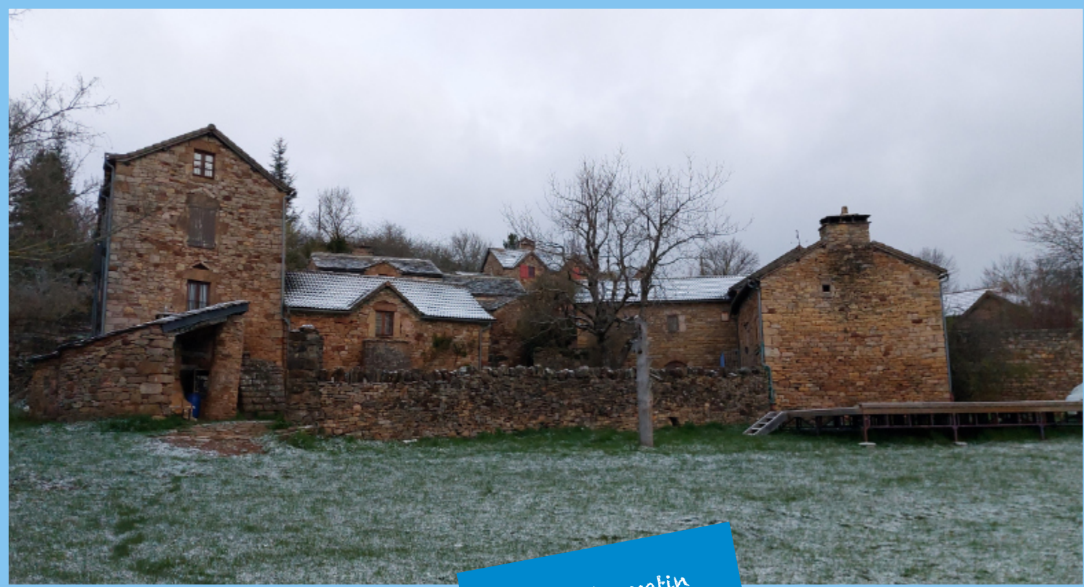
Neige du matin