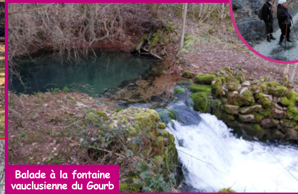
Balade à la fontaine vaclusienne du Gourb