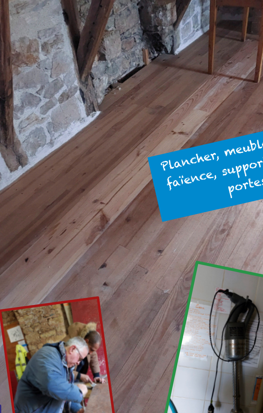
Plancher, meuble lavabo, faïence, support mixeur, portes