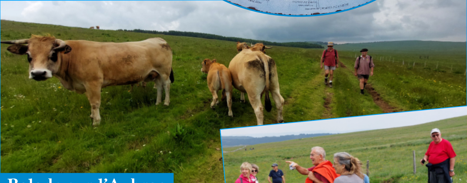
Balade sur l'Aubrac